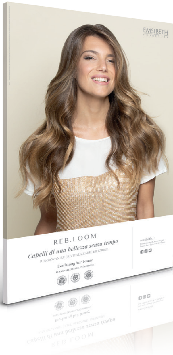
Cartello Vetrina 80 x 120 cm Window Poster Cartel escaparate EMVo1021